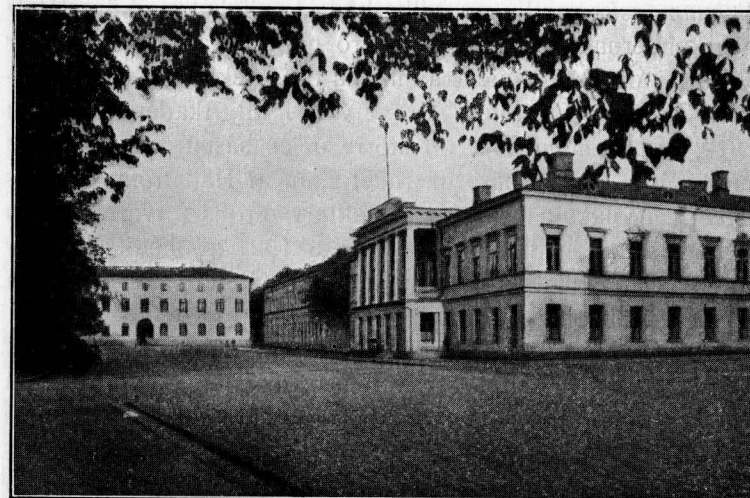
ÅBO AKADEMIS HUVUDBYGGNAD, DÄR BIBLIOTEKET ÄR INRÝMT, I BAKGRUNDEN F. D. AKADEMIHUSET

Så länge löpande arbetsuppgifter av detta slag, med deras direkt praktiska syfte i det akademiska forskningsarbetets tjänst, taga biblioteksförvaltningens hela uppmärksamhet i