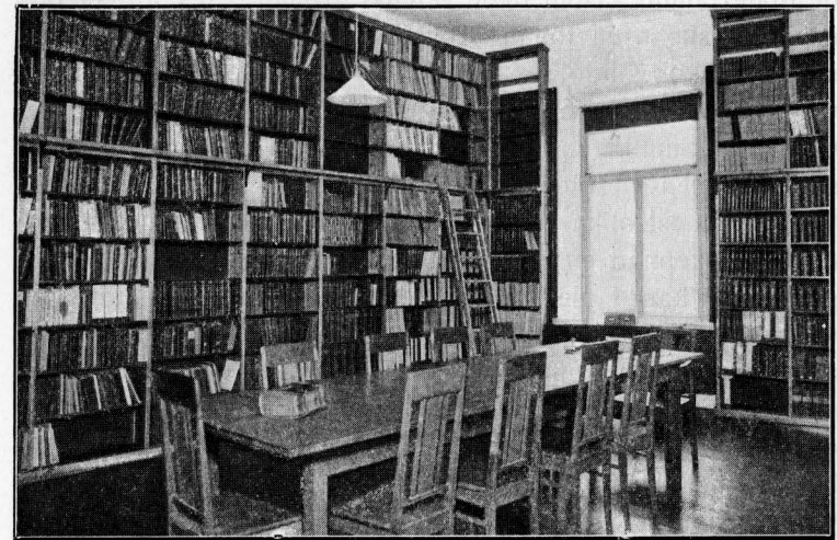
RÄTTSVETENSKAPLIGA SEMINARIETS BIBLIOTEK

giftsstat för läsåret 1921—22. Framst tack vare medel, för tillfället donerade av enskilda personer, har inköpsverksam- heten dock aldrig helt avstannat. (För närmare uppgifter om dessa donationer hänvisas till årsredogörelserna.) Efter den storartade hjälpaktionen hösten 1923, då en summa av 24,000 kronor på initiativ av finländska och rikssvenska da- mer i Stockholm insamlades till förmån för Åbo Akademis