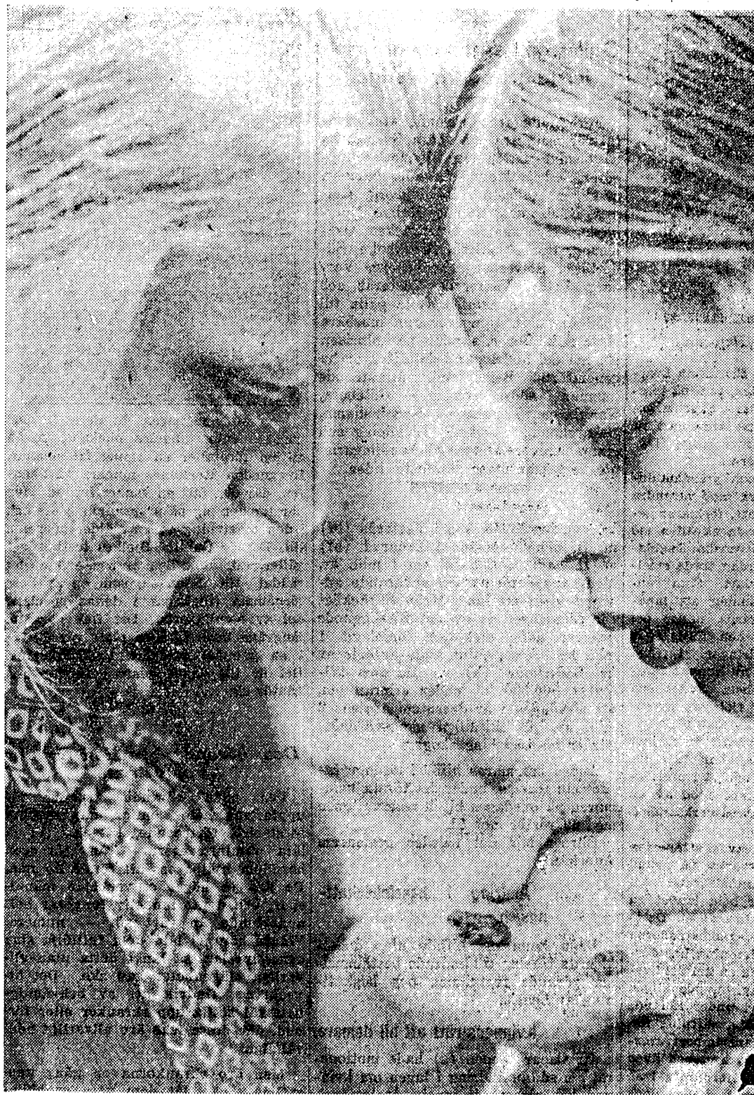
De första grodorna — 1932