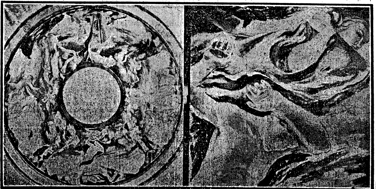
2. palkinnon saanut luonnos.