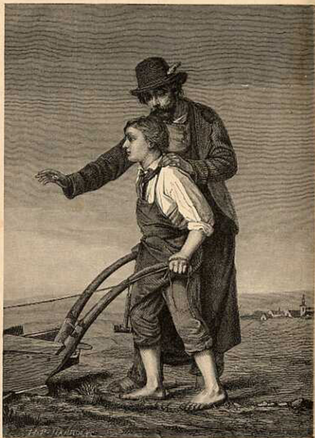
The first glimpse of the rugged land of the island.