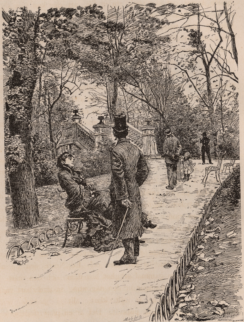
I Parc de Monceaux.