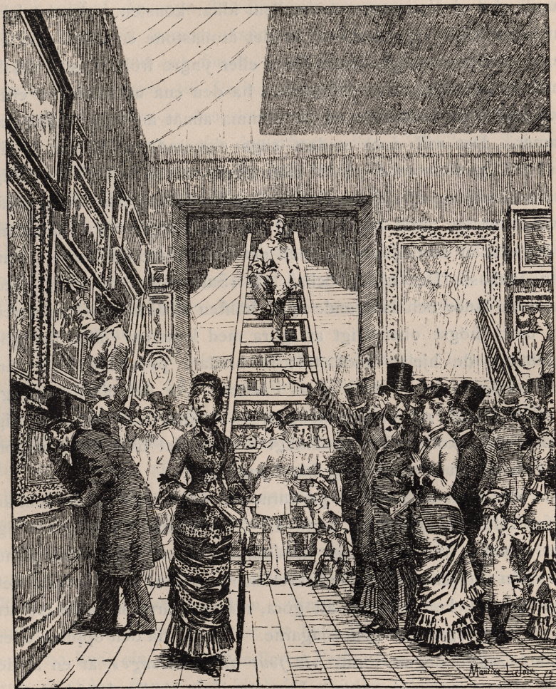
På Salongen vernissagedagen.

som de icke få ha, då de insändas till bedömande. Men småningom har det blifvit »tout Paris» som är med på den stora generalmönstringen. Har man något slags anspråk på att höra